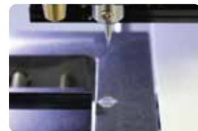
공구길이 자동측정 센서