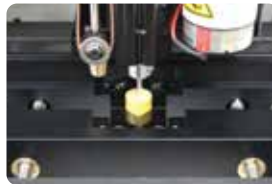
다목적 V홈 지그